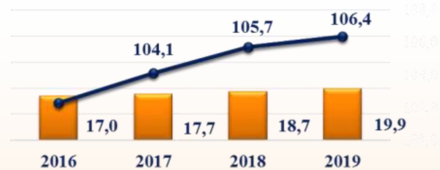
Объем платных услуг, оказанных населению, млрд. руб.

— Темп роста к предыд. году, % - Норильск