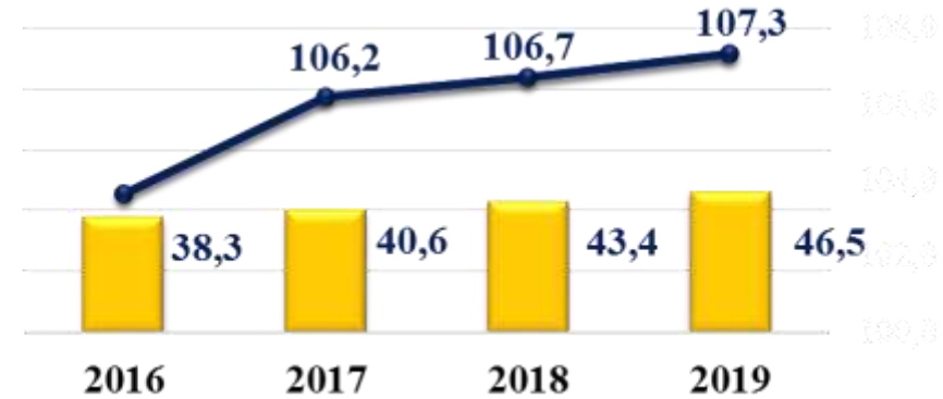
Оборот розничной торговли, млрд. руб.