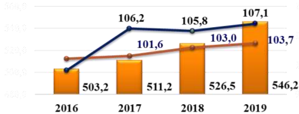
Объем отгруженной продукции, млрд. руб.