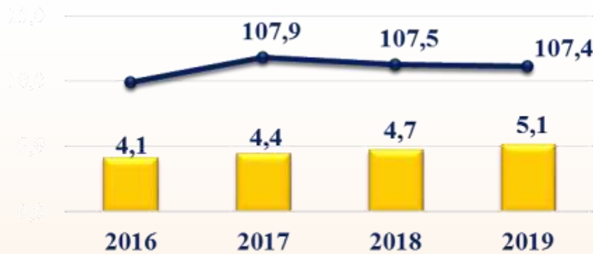
Оборот общественного питания, млрд. руб.